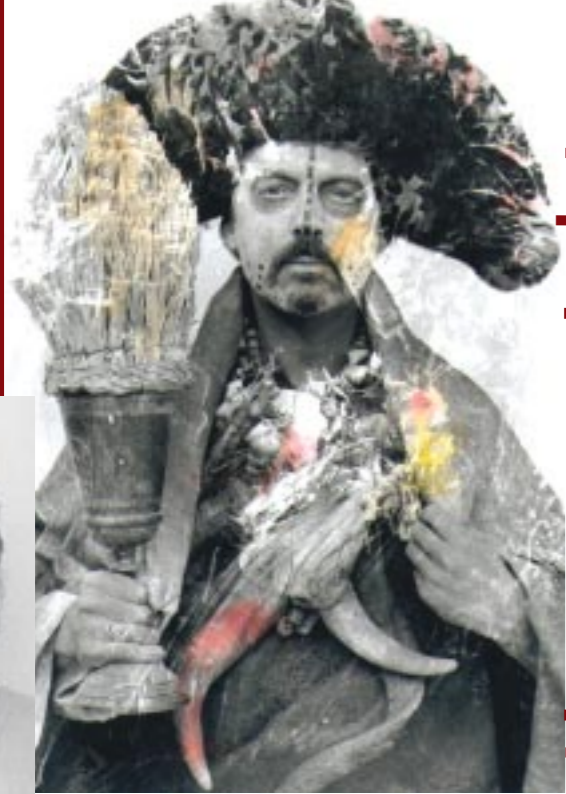
Atum - Meditationslehrer -